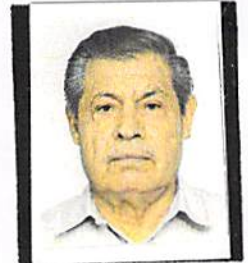
FOTO DEL SOLICITANTE

(DIRECCIÓN DE REGLAMENTOS FISCALIZACIÓN Y CONTROL)